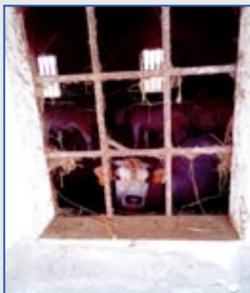
2° CENA FULVIO di Chivasso (TO) "Una finestra sul cortile"