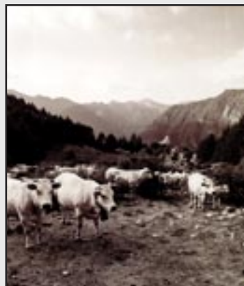
1° RISSO NICOLA di Scarnafigi (CN) "Pronte per il ritorno"