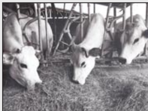
2° PAROLA GIULIA di Cuneo "Luci e Ombre"