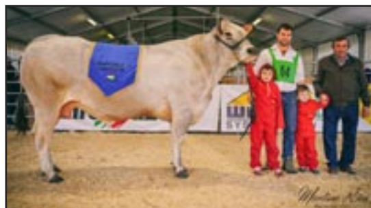
CAMPIONESSA ASSOLUTA: CAVERNA SOC. AGR. RUBINETTO F.LLI - POIRINO - TO