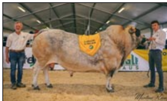
CAMPIONE RISERVA: CR7 ROSSO LORENZO - POIRINO - TO